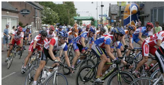
Linieløbet er i gang. Der er positionskamp i hvert sving.

Kl. 15.30 gik starten, og der ventede rytterne 30 omgange af 4 km - i alt 120 km. Efter 1 km. kørsel blev løbet givet frit. Det var som at tage proppen af en flaske champagne. Den første time blev gennemført med ca. 50 km/t.