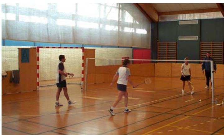
Der blev gået til den i Frederikshavn

Vel ankommet til Flådestationen blev vi indkvarteret, og så var det tid til et par timers velfortjent søvn, inden vi for alvor skulle i kamp om lørdagen. Der blev spillet mange gode og lange kampe, og der blev heppet fra sidelinien. Vi ville gerne have taget flere medaljer hjem end tilfældet var, men vi må bare blive bedre til næste år, når vi mødes i Århus.