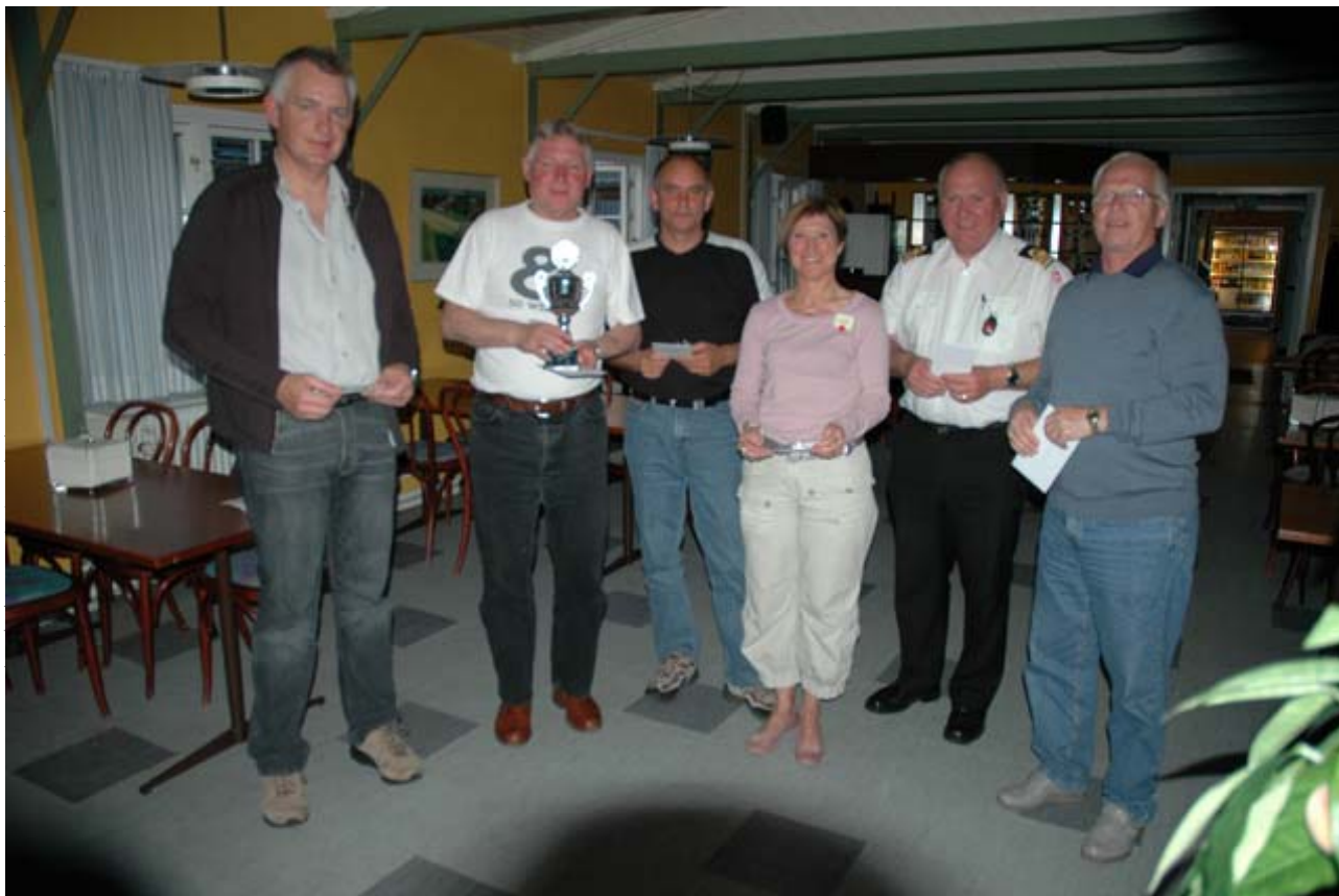
Vinderne af turneringen Anders Open 2006.