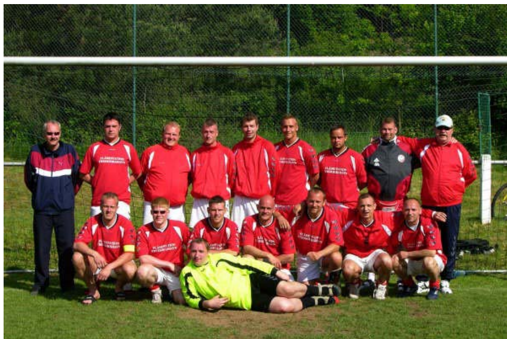
Det danske hold klar til kamp.